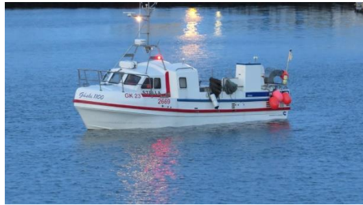
Stella GK 23

Stella GK er smábátur með tvær kojur, veiðarfærin eru 4 handfærarúllur alls 20 krókar og eru róðrar gjarnan lengri en 14 klst. Rifsnes SH er útilegulínuskip með 35-40.000 króka og 14 manns í áhöfn.